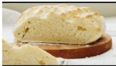
Ejemplo de pan sin levadura

NO se ha contemplado un desayuno en los cursos pero si las directivas quieren entregar un regalito a los estudiantes se puede coordinar con el profesor jefe.